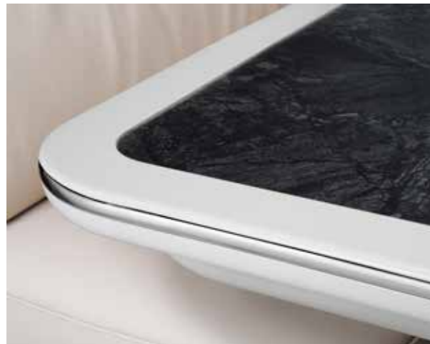
Tischplatte „Schiefer“ mit Randleiste in Vanille