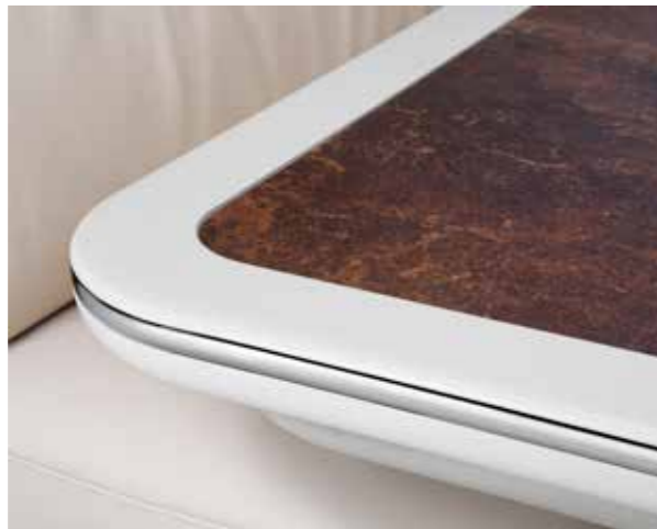
Tischplatte „Kupfer“ mit Randleiste in Vanille