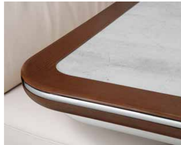
Tischplatte „Marmor“ mit Randleiste in Macadamia