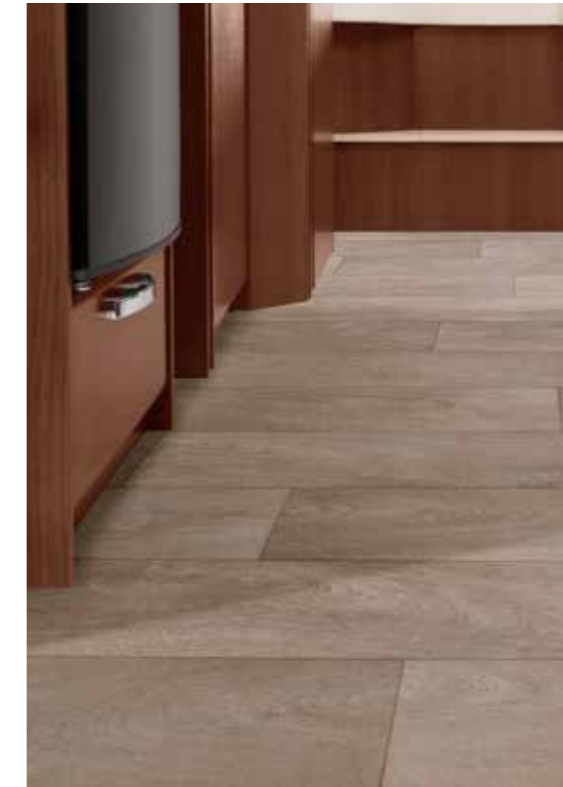
□ Cappuccino (optional)