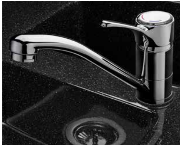
Morelosan Pepper (optional)

Beim Wohnraumbereich haben Sie die Wahl zwischen drei verschiedenen Dekoren mit Randleisten entweder in „Vanille“ oder „Macadamia“ und strapazierfähigen, kratzunempfindlichen Schichtstoffoberflächen. Die Arbeitsplatte in der Küche bietet drei Dekorvarianten und optional eine hochwertige Morelosan-Oberfläche. Spül- und Restbecken sind nahtlos eingepasst, die Arbeitsplatte lässt sich so sehr leicht und komfortabel reinigen.