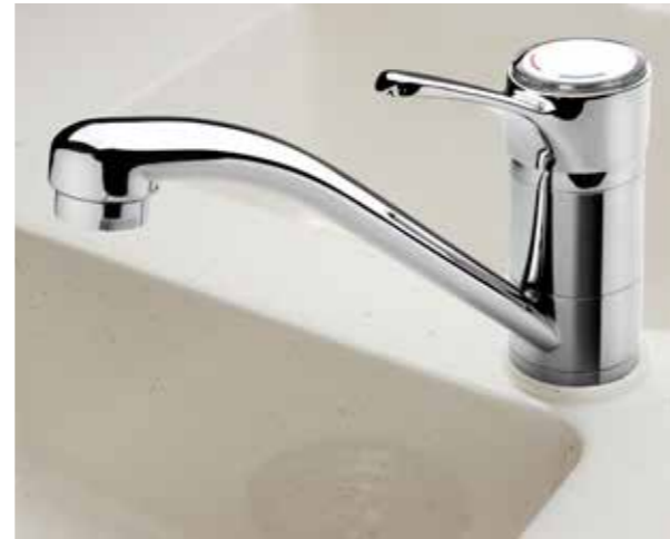
Morelosan Salt (optional)