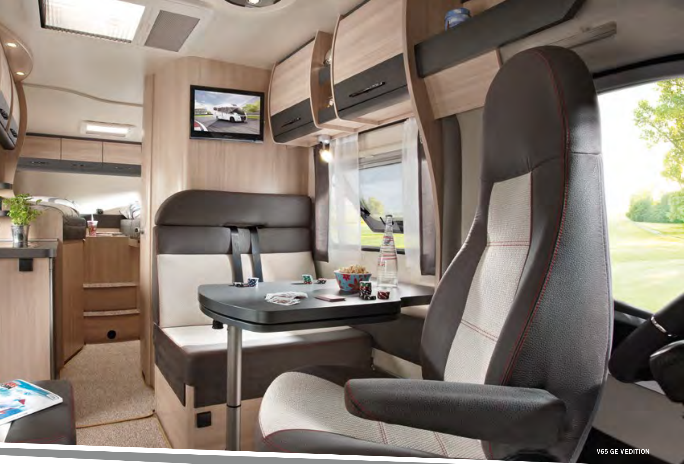
V65 GE VEDITION