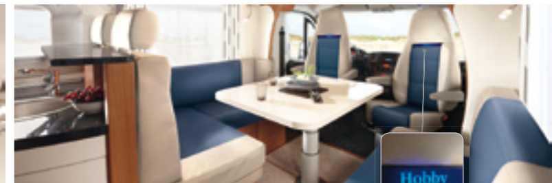
PREMIUM Ocean inklusive LED-Hobby-Logo