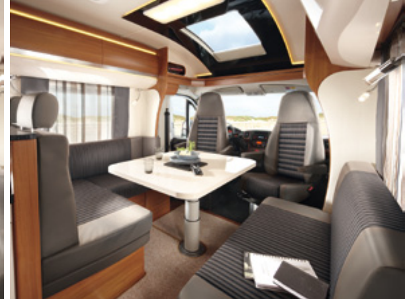
PREMIUM Vik (Serie)