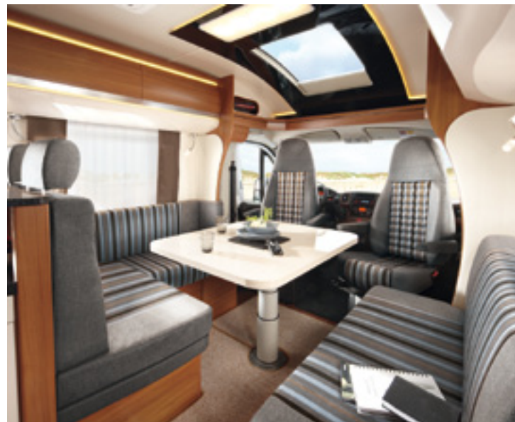
SIESTA Boston (Serie)