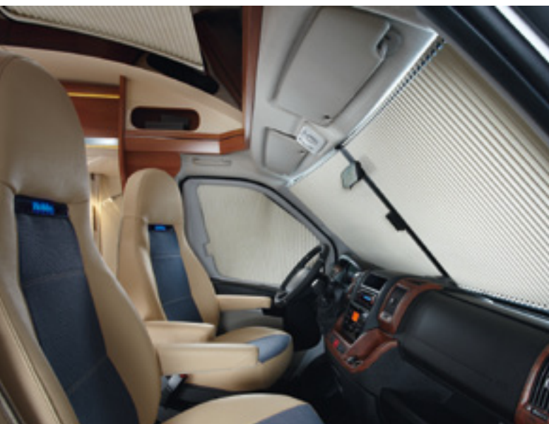
Plisse-Faltsystem im Fahrerhaus