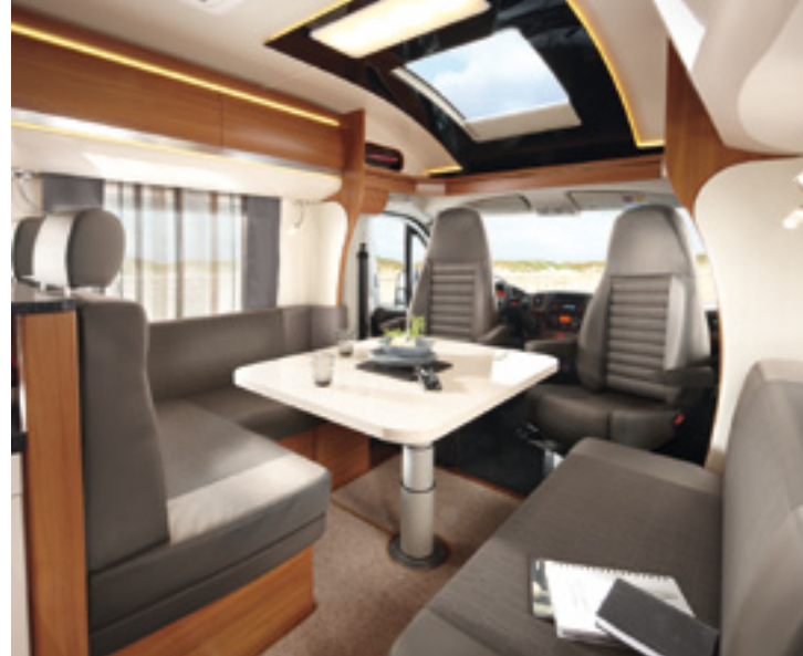
PREMIUM Tacora (Serie)

Wählen Sie zwischen den serienmäßigen Polstervarianten Tacora und Vik oder entscheiden Sie sich für die optionalen Polster Lascar und Ocean? Wer Leder mag, hat die Wahl zwischen den Varianten Uni/Cremeweiß oder Braun/Cremeweiß.