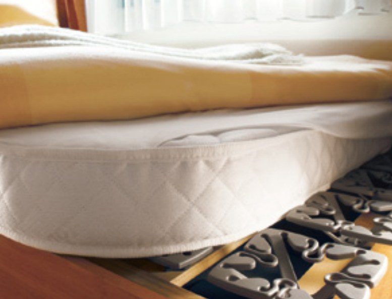
FROLI-Komfort-Bettssystem mit Kaltschaummatratze