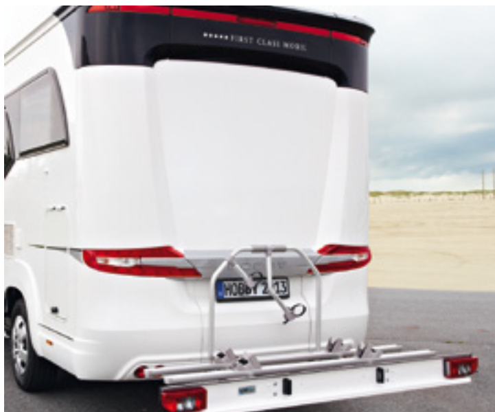
Fahrradträger mit niedriger Ladehöhe, auch für E-Bikes geeignet