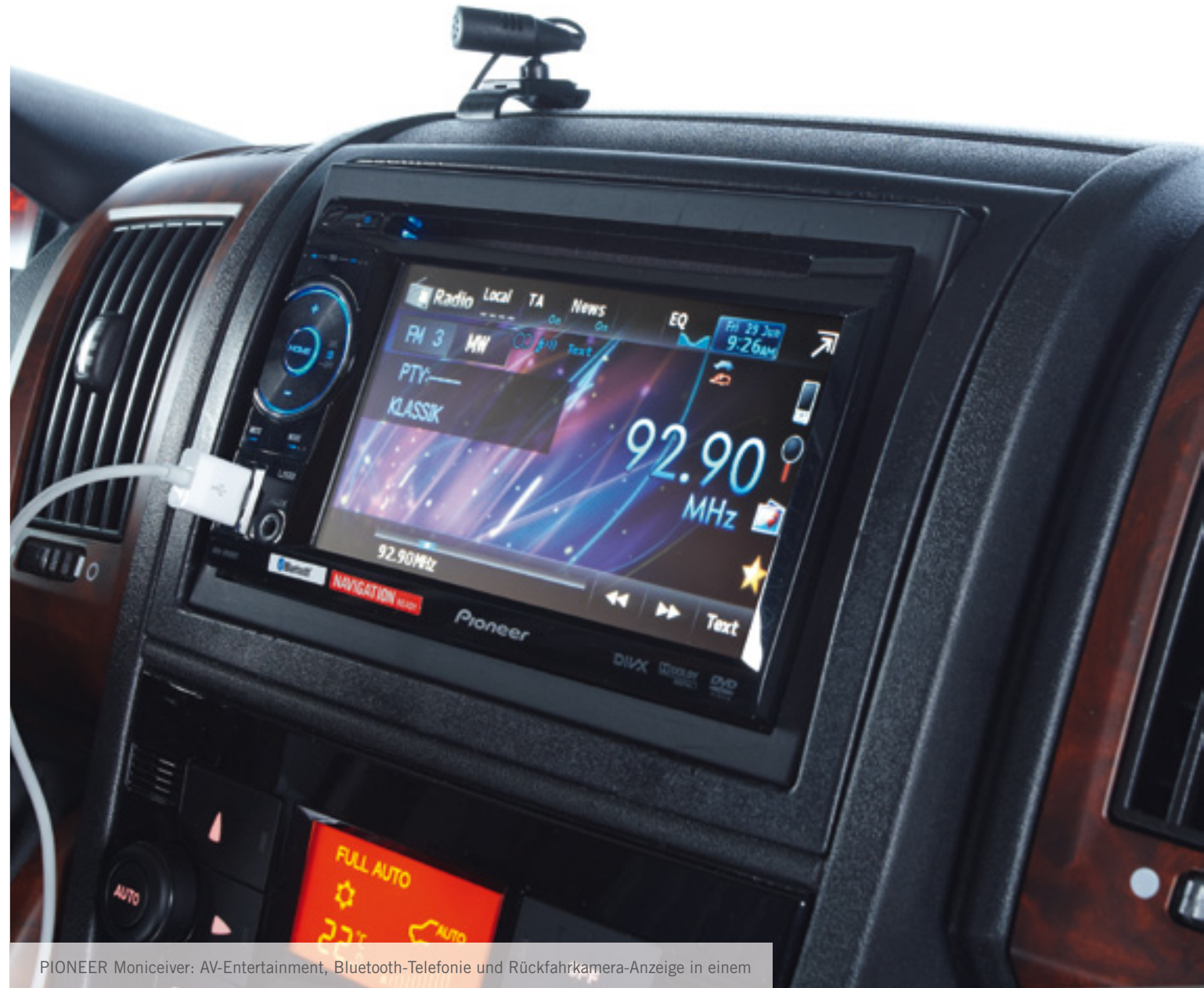
PIONEER Moniceiver: AV-Entertainment, Bluetooth-Telefonie und Rückfahrkamera-Anzeige in einem

Im Cockpit bietet Ihnen der PIONEER Moniceiver AV-Entertainment und Bluetooth-Telefonie in einem. Schnurlos plaudern Sie mit den Lieben daheim, hören genau die Musik, die zu Ihrer Stimmung und der vorbeihuschenden Landschaft passt – und können dank der schnellen und hochpräzisen Navigationstechnologie mit TMC-Empfänger in 44 europäischen Ländern jeden Stau prompt umfahren.