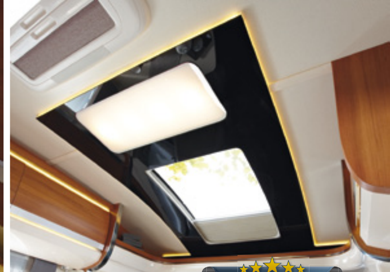
Acrylglasrahmen mit indirekter Beleuchtung und Deckenlampe