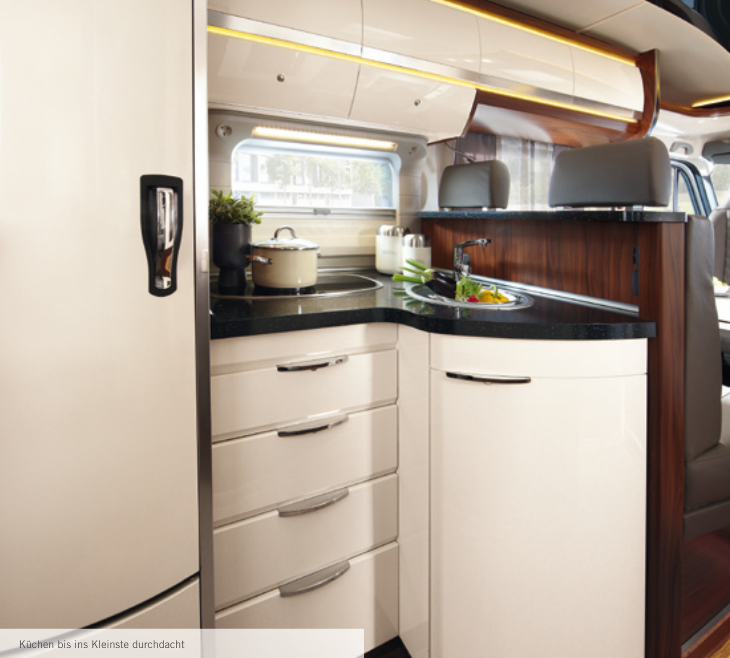
Küchen bis ins Kleinste durchdacht