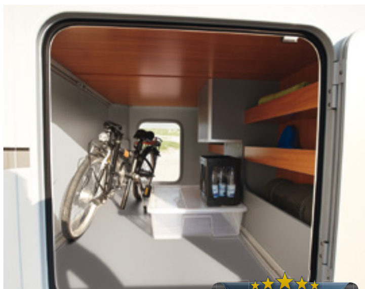
Garagen-Komfort-Ausstattung mit praktischen Regalen