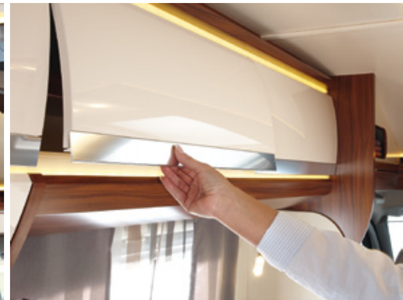
Durchgängige Aluminium-Griffleisten mit verdeckten Verschlüssen