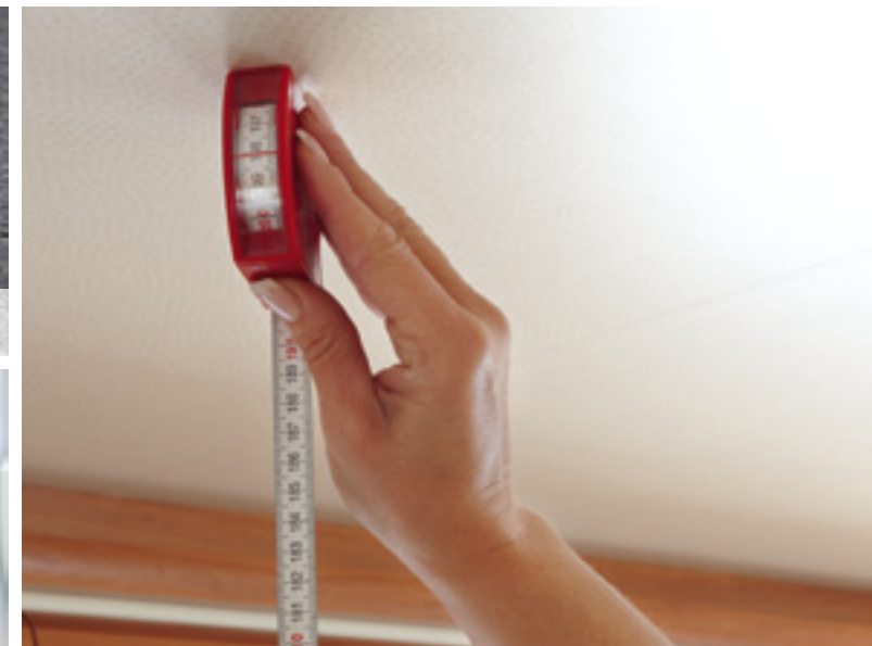
Komfortable Innenstehhöhe bis zu 1,98 Meter