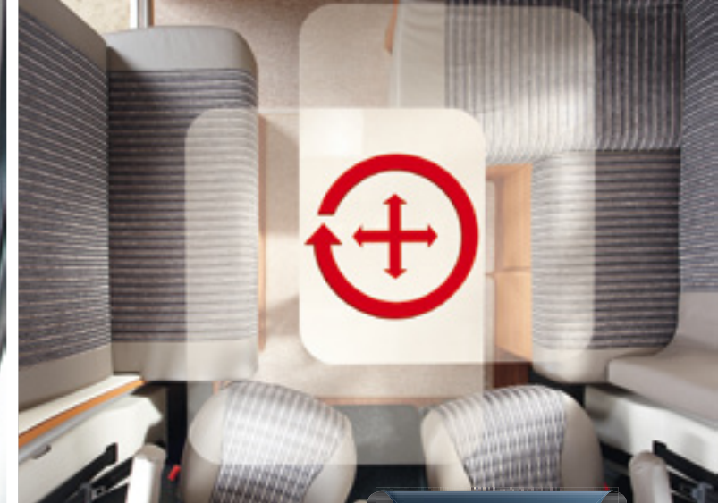
Dreh- und verschiebbarer Hobby Luxus-Wohnraumtisch