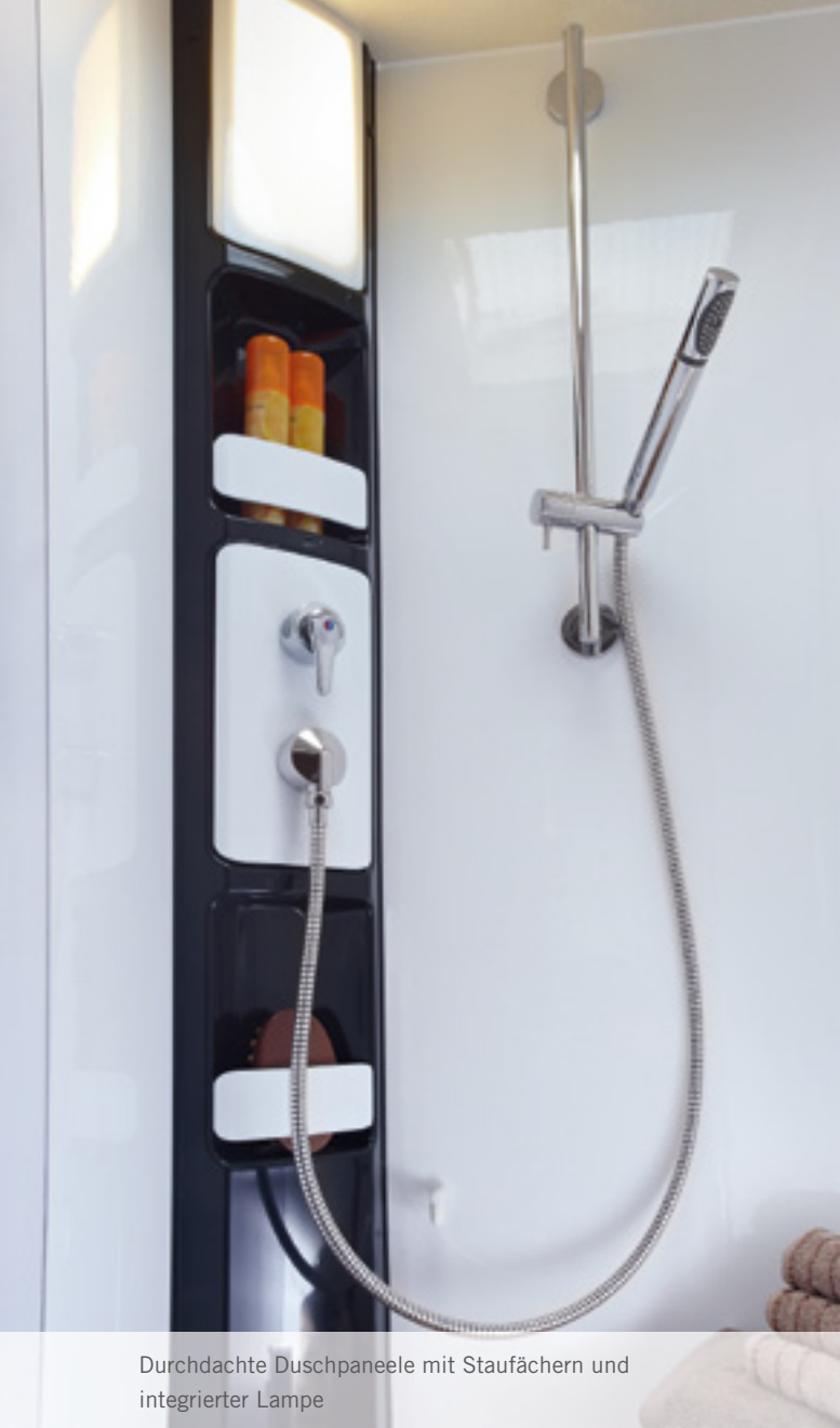
Durchdachte Duschpaneele mit Staufächern und integrierter Lampe