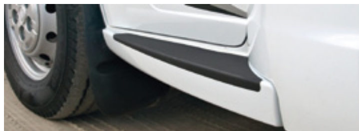
Trittstufe Fahrerhaus (PREMIUM DRIVE)