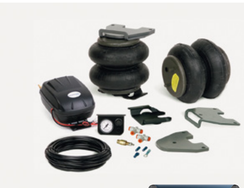
Zusatzluftfedern von GOLDSCHMITT