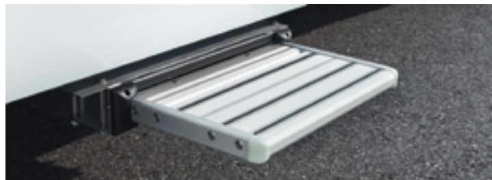
Elektrisch ausfahrbare Einstiegsstufe