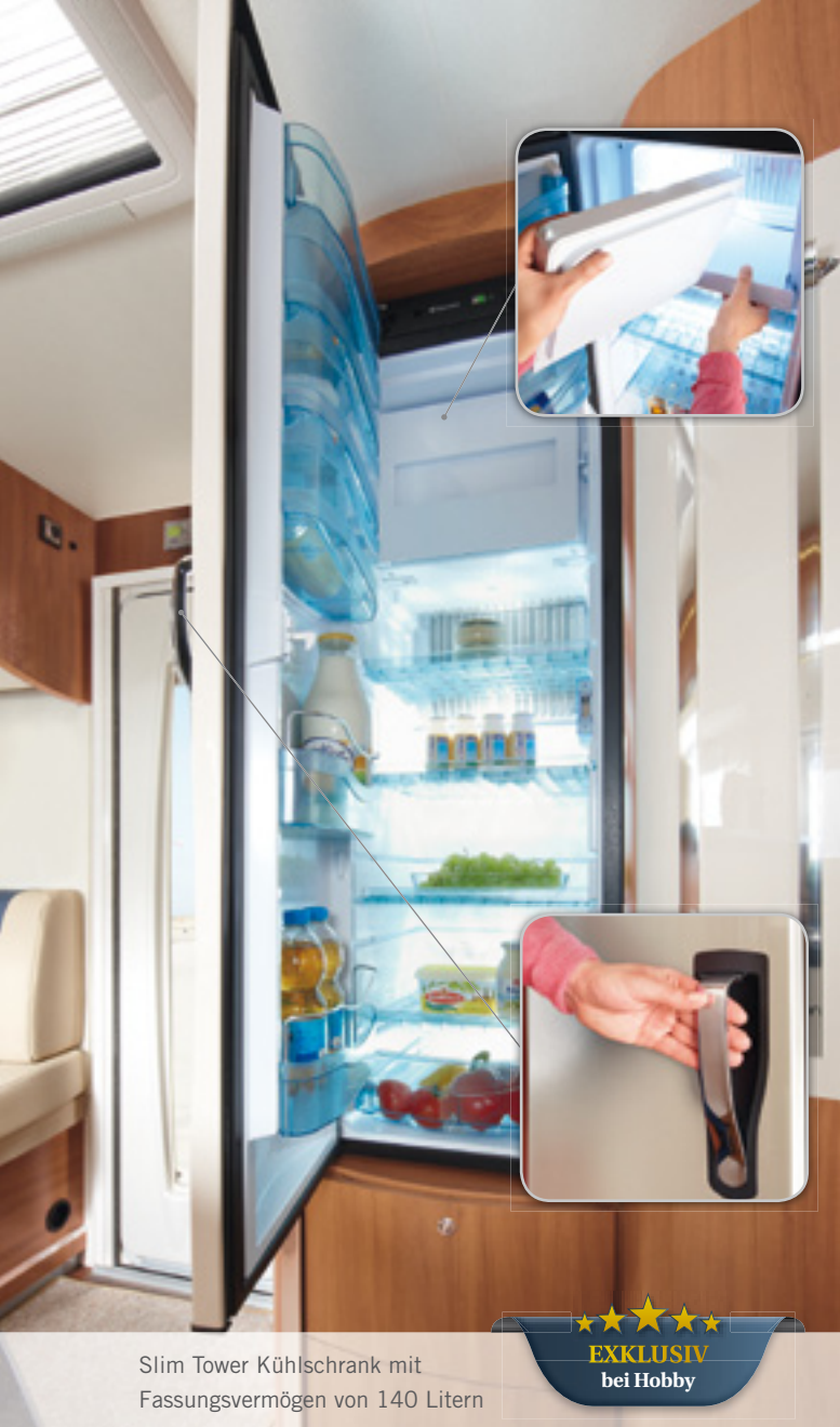
Slim Tower Kühlschrank mit Fassungsvermögen von 140 Litern