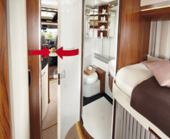
Raumbadkonzept PREMIUM VAN mit verschiebbarem Waschbecken