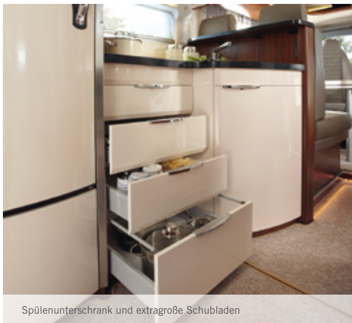
Spülenunterschrank und extragroße Schubladen