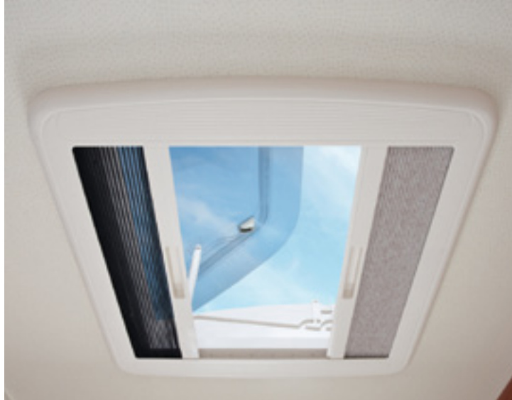
DOMETIC-SEITZ-Dachhaube Mini-Heki sorgt für Licht und gute Belüftung