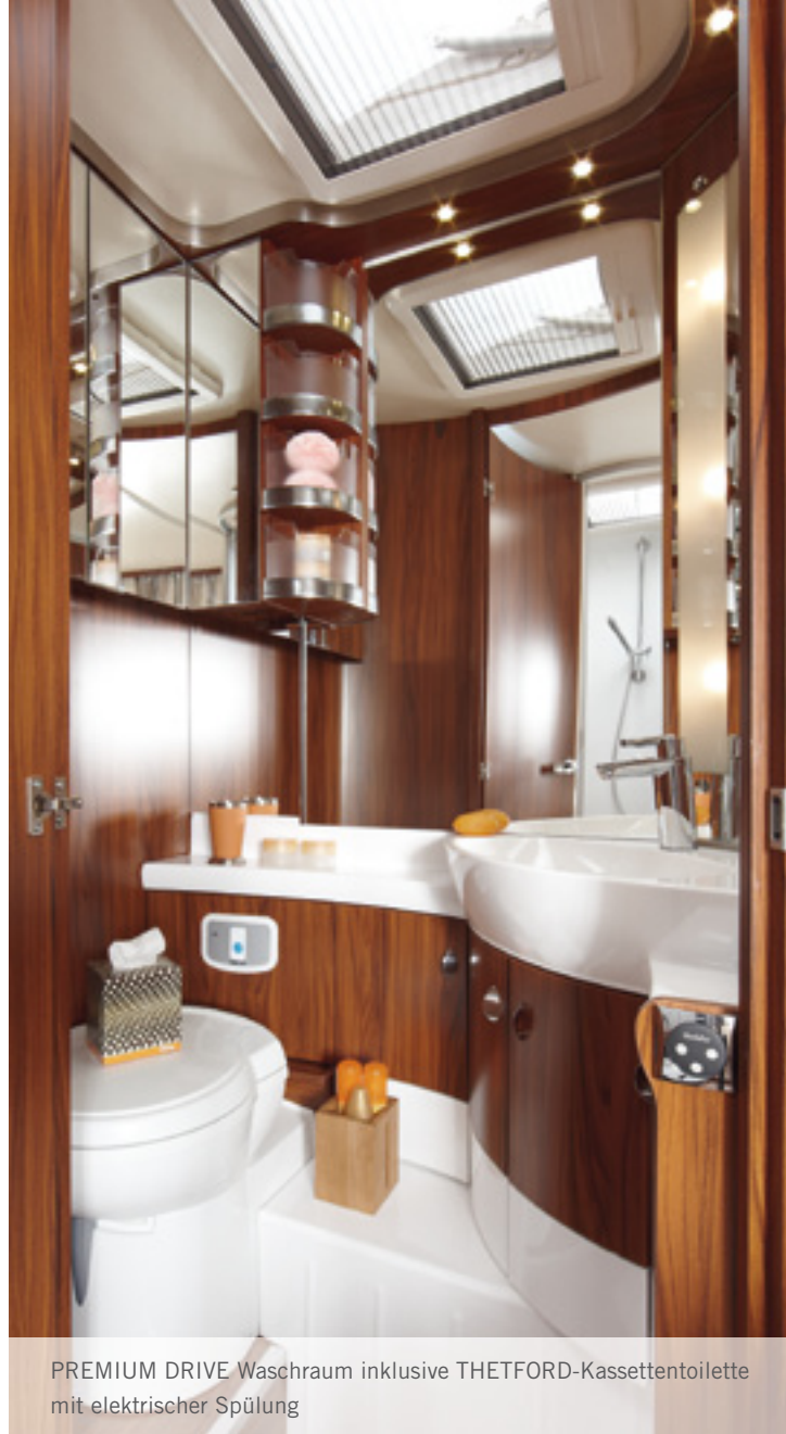
PREMIUM DRIVE Waschraum inklusive THETFORD-Kassetten-toilette mit elektrischer Spülung