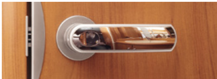
Ergonomisch geformte Türgriffe