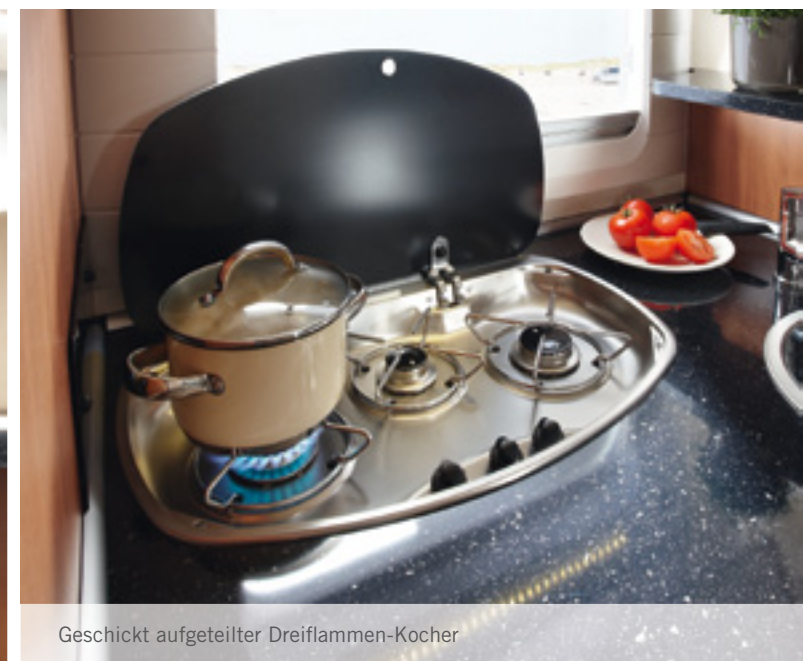
Geschickt aufgeteilter Dreiflamm-Kocher