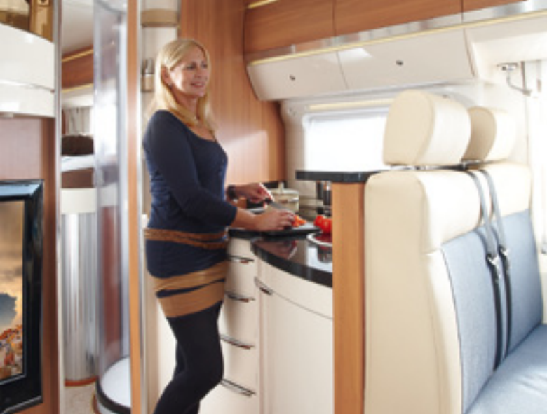
Rückenfreundliche Arbeitshöhe von 91 Zentimetern