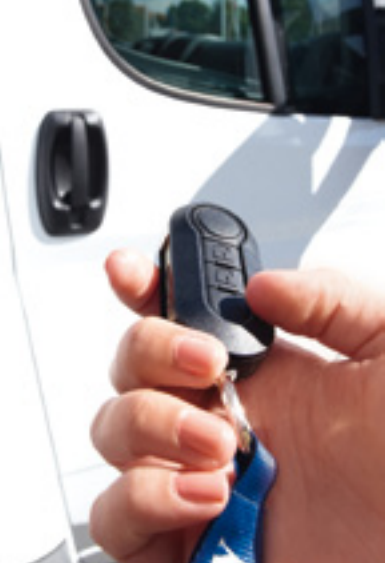
Zentralverriegelung mit Fernbedienung