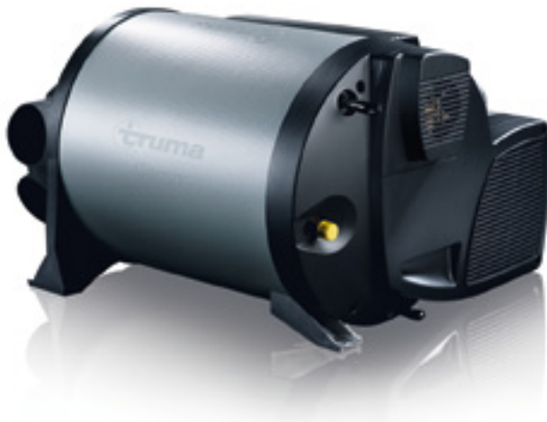
TRUMA-Combi-Warmluftheizung mit Boiler