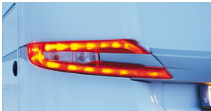
LED-Heckleuchte für bessere Sichtbarkeit im Straßenverkehr