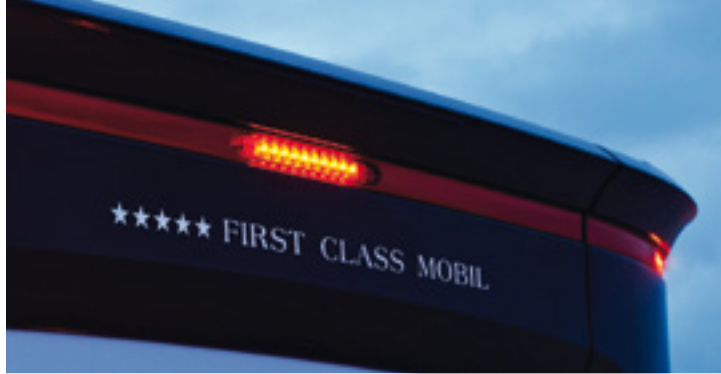
Dritte Bremsleuchte in LED-Technik