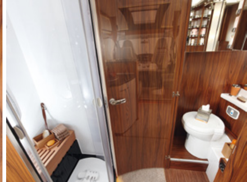
PREMIUM DRIVE Raumbad für mehr Freiraum