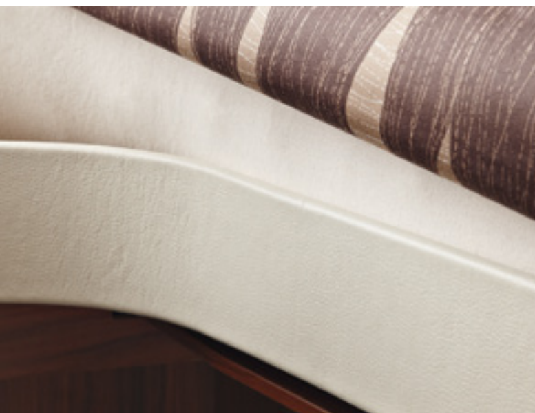
Pflegeleichte Bettumrandung in Lederoptik