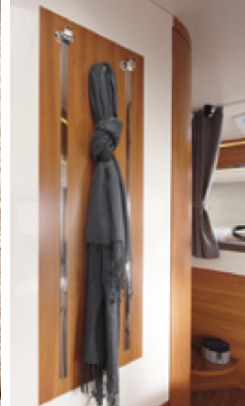
Edel verarbeitete Garderobenwand