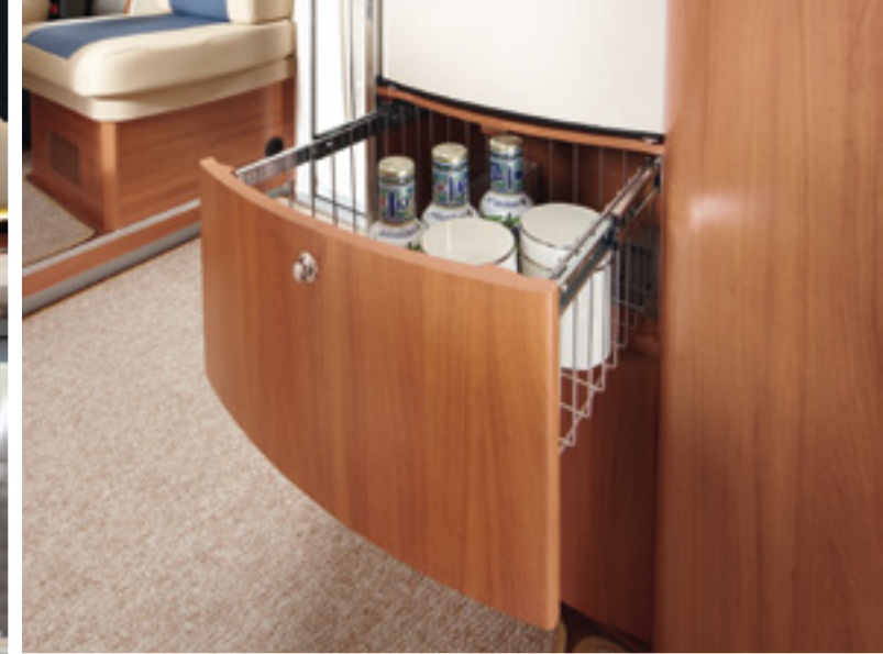
Praktischer Auszugskorb unter dem Slim Tower Kühlschrank