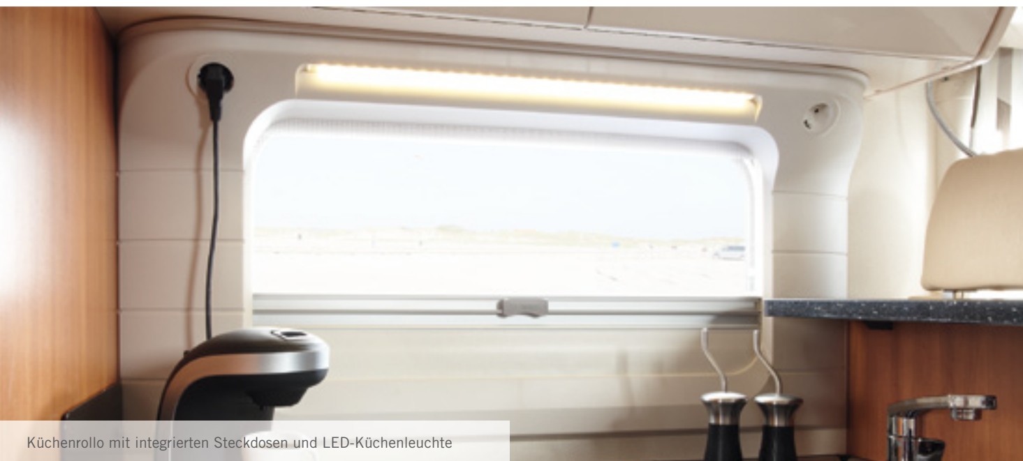
Küchenrollo mit integrierten Steckdosen und LED-Küchenleuchte