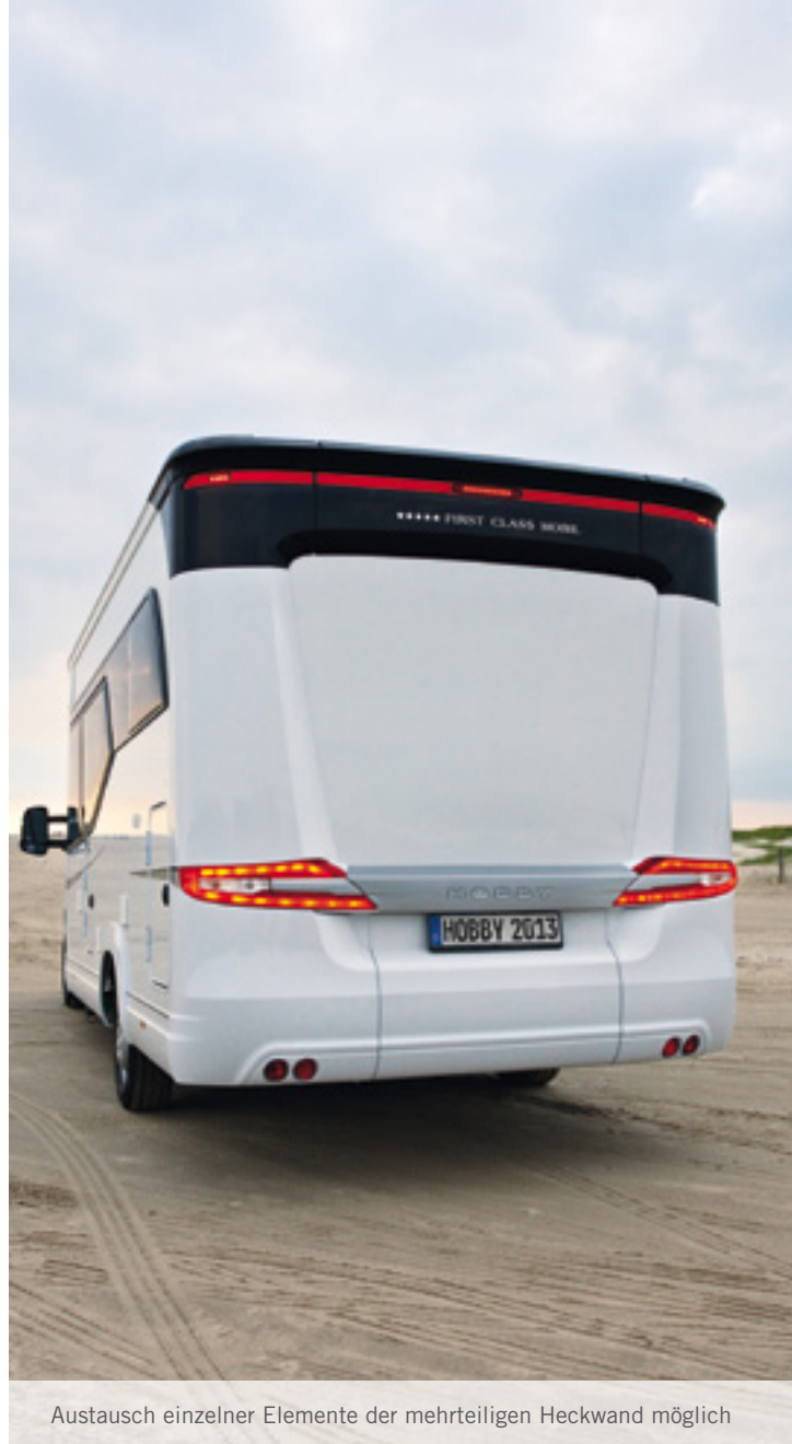
Austausch einzelner Elemente der mehrteiligen Heckwand möglich

Schick und funktional zugleich zeigt sich die Aufbauart. Außen fügt sie sich harmonisch in das Fahrzeugdesign ein, innen nehmen Fächer allerlei Kleinutensilien auf. Ein Fenster sorgt für Durchblick und schützt mit integriertem Plissee vor neugierigen Blicken.