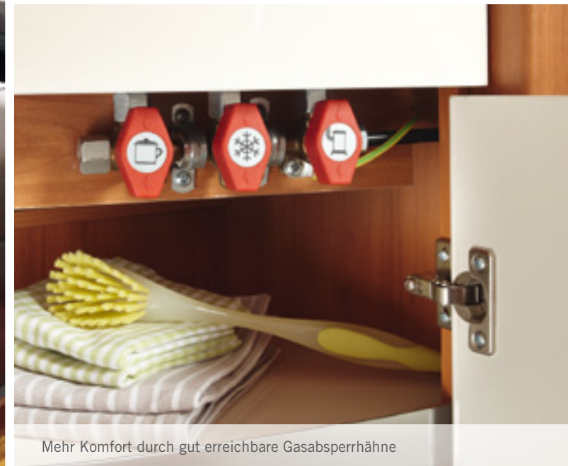
Mehr Komfort durch gut erreichbare Gasabsperrhähne