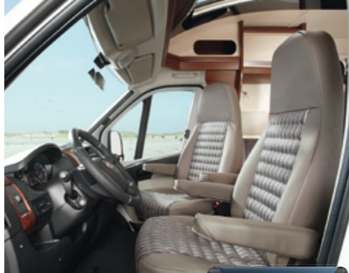
Höhenverstellbare Fahrersitze in Wohnraumstoff bezogen

Ein weiteres Plus in Sachen bedarfsgerechte und flexible Einrichtung ist der Hobby Luxus-Wohnraumtisch: Er lässt sich nicht nur um 360 Grad drehen, sondern ist verschieb- und absenkbar.