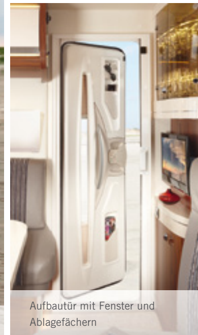
Aufbautür mit Fenster und Ablagefächern