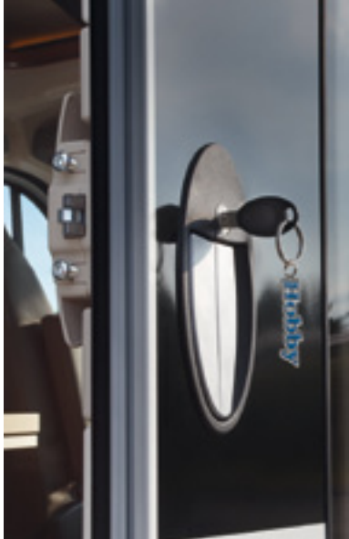
Tür mit Sicherheitschloss