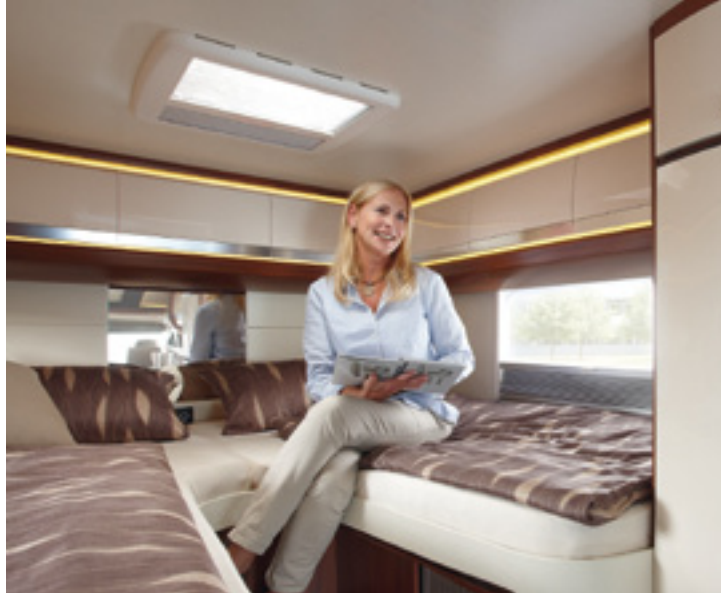
Große Kopffreiheit im Schlafbereich