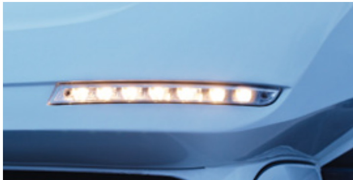
LED-Positionsleuchten an Front und Heck